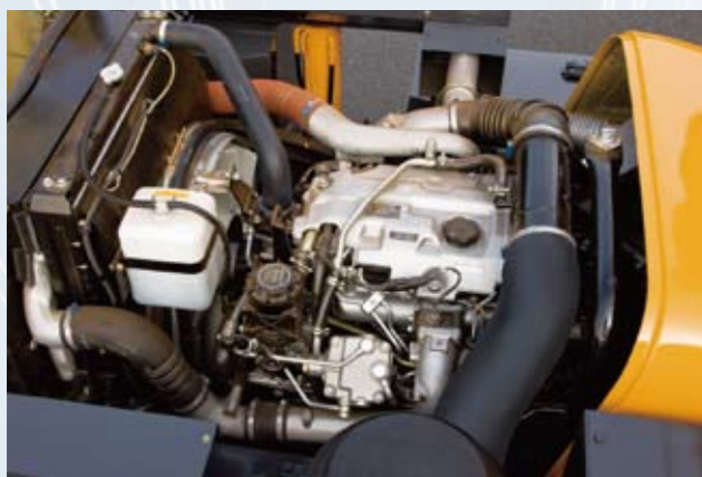
▲メンテナンス性を考慮したレイアウトのエンジンルーム

噴射圧力と噴射時期の制御自由度が高く、最適な燃料噴射を可能にします。クリーンで静かなエンジンです。