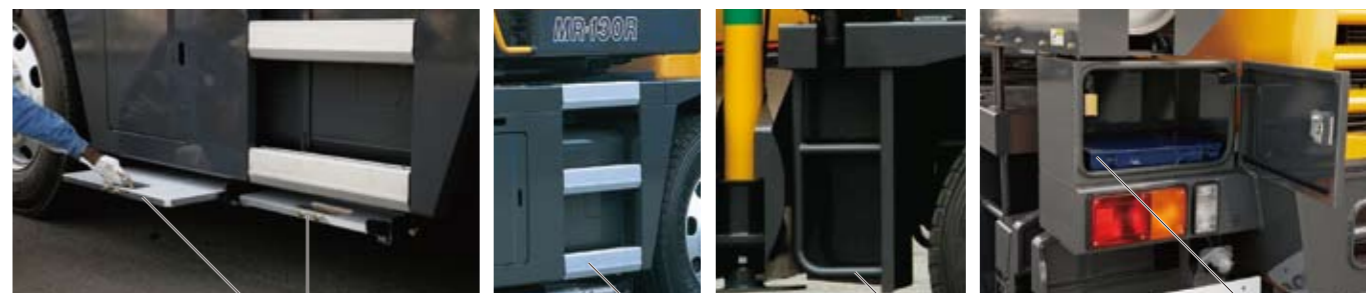
アルミ製敷板を標準装備 (600×600mm)