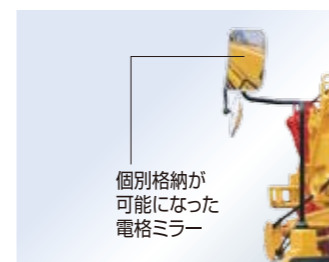
個別格納が可能になった電格ミラー