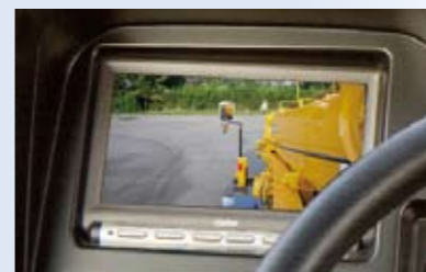
◀写真はハメコミ合成画像です。